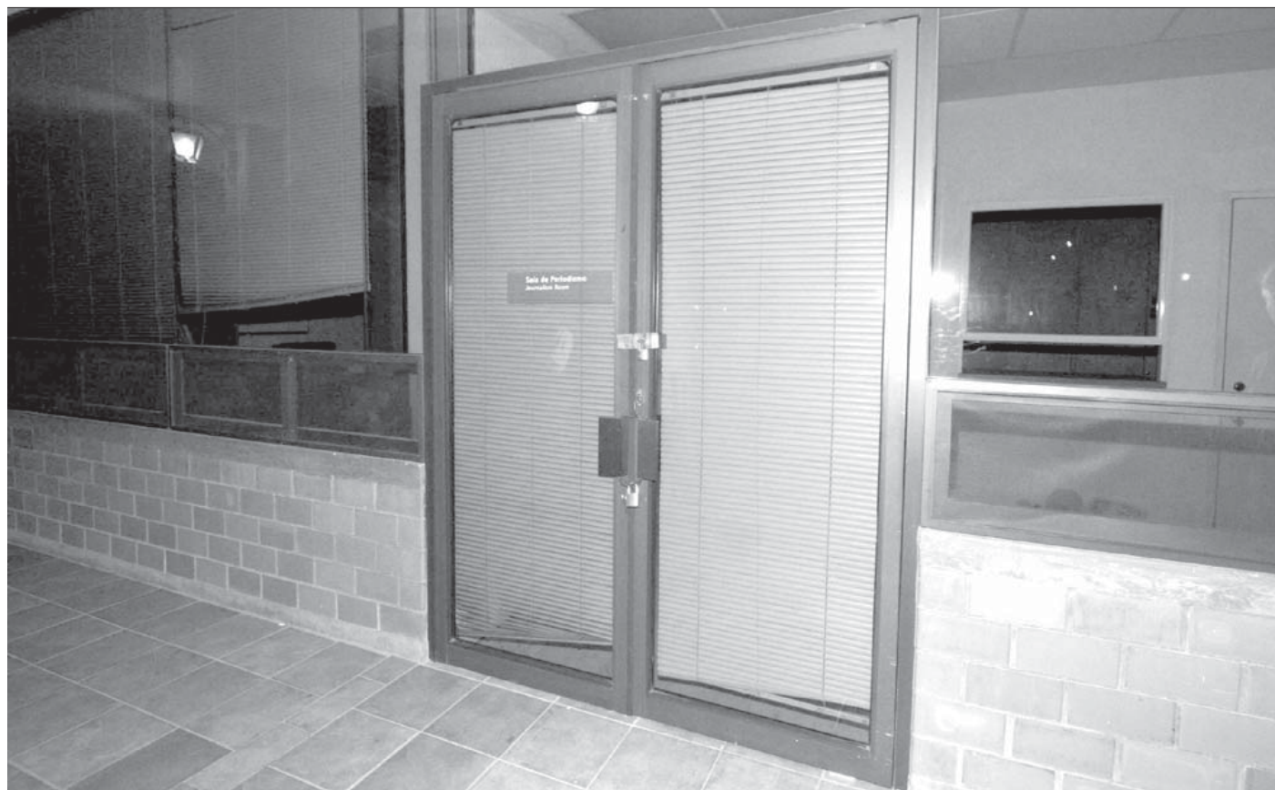
El rector de la UDLAP mandó a cerrar el semanario "La Catarina"