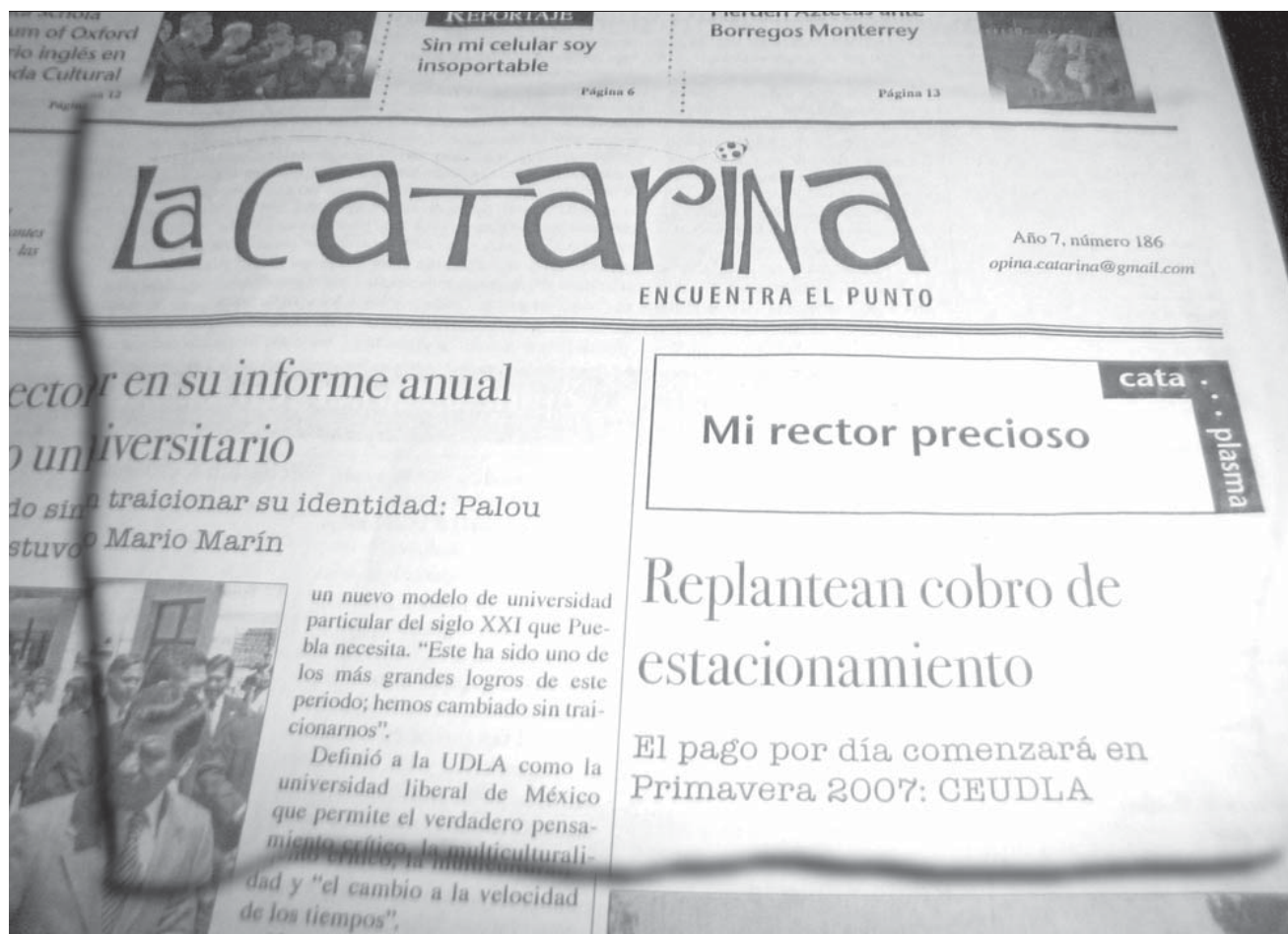
Anexo 1. Mi rector precioso".