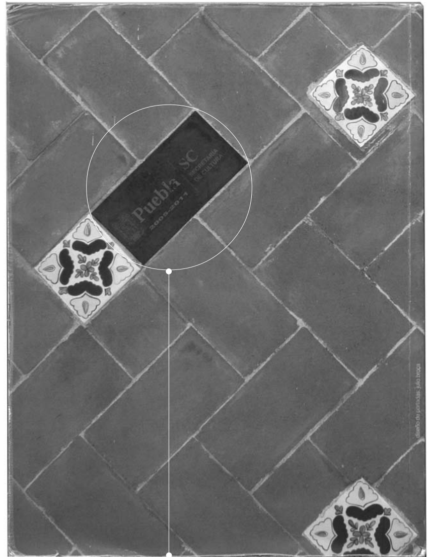
Portada y contraportada de la última reedición de Las Calles de Puebla, únicamente se da crédito y aparece logotipo del gobierno del estado.