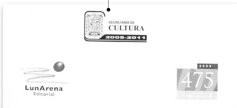
Al interior ya se nombra al ayuntamiento, aparece el logotipo de los festejos del 475 aniversario de la fundación de la ciudad de Puebla a pesar de que nunca se llegó a un acuerdo para una coedición. También aparece el logotipo de LunArena.